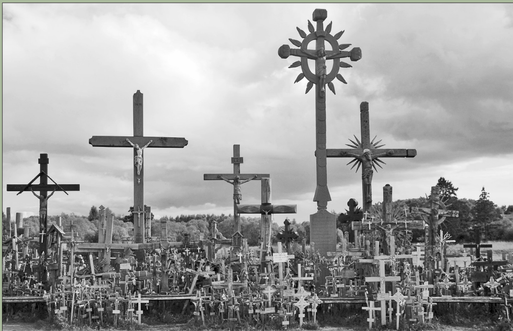
Kryžių kalnas. 2008.

Taigi žmonių sąmonėje konkreti geografinė vieta atsimeinama siejant su tam tikrais simboliais, sentimentais ir istorijomis. Vieta yra tartum kultūrinis tekstas, kuriame atpažįstame jo skaitytojų tapatumą, gyvenimo būdą ir požiūrį 17 . Kraštovaizdis yra simbolis, persijotas kultūrinio filtro ir maitinamas interpretacijomis bei vertinimais 18 . Kita vertus, savo darbą atlieka ir turizmo industrijos vadybininkai, kelionių organizatoriai. Jų skleidžiama informacija internete, televizijoje, reklaminiuose leidiniuose padeda sukurti vietos legendą ir parduoti keliones pačių įvairiausių pažiūrų žmonėms.