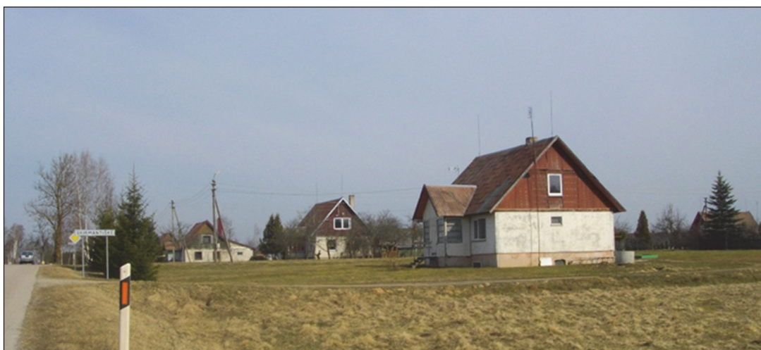
1 pav. Sovietmečiu statyti tipiniai surenkamų konstrukcijų (skydiniai) gyvenamieji namai Skirmantiškėje (Raseinių r. savivaldybė), 2014

Visa šalies gyvenviečių sistema buvo pertvarkoma direktyviniais metodais planuojant įmonių plėtrą, gyventojų skaičių ir jų aptarnavimo įmonių plėtrą. Gyvenviečių vietos būdavo iš anksto numatomos rajoninio planavimo schemose, o pačios gyvenvietės kuriamos pagal išplanavimo projektus. Vienam kolūkiui ar tarybiniam ūkiui buvo numatoma viena centrinė ūkio gyvenvietė ir kelios pagalbinės gyvenvietės, kurios būdavo perplanuojamos ir pritaikomos kolchozinio ūkio tikslams (Lietuvos TSR..., 1974). Centrinę kolūkių gyvenviečių (kaimų) kūrimas taip pat turėjo savos specifikos – siekiant gyventojus atitolinti nuo religijos, dalis centrinių gyvenviečių buvo kuriamos naujose vietose arba dirbtinai išplečiamos mažų kaimelių, kuriuose nebuvo bažnyčios, vietose (nors už kelių kilometrų buvo didesnis bažnytkaimis, kuris būtų tikęs kolūkio centrui įkurti). Tačiau dėl gana tankaus bažnytkaimių tinklo Lietuvoje tai nebuvo labai dažni atvejai.