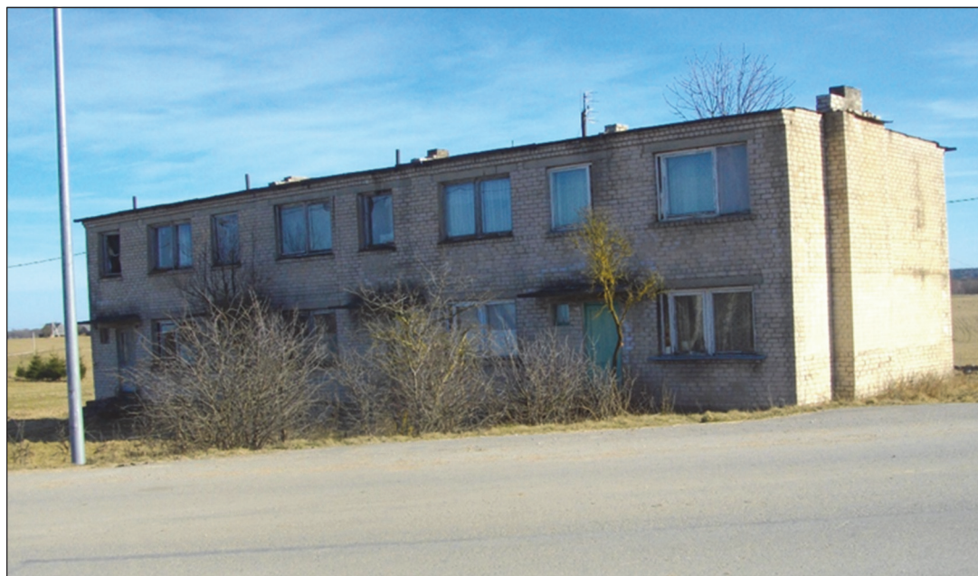
2 pav. Sovietmečiu statytas aštuonių butų namas Nemaitonių kaime (Kaišiadorių r. savivaldybė), 2014

žemės, kolūkietis dar „gaudavo“ 60 arų žemės ūkio naudmenų, šią žemę žmonės dažnai tiesiog atiduodavo kolūkiui įdirbti ir už tai gaudavo atitinkamą kiekį grūdų pašarams). Dalis namų (senesnės statybos) buvo mediniai, dalis – mūriniai. 1949–1981 m. namus buvo leidžiama statyti tik iki 60 m 2 gyvenamojo ploto, vėliau plotas padidintas iki 90 m 2 (Galaunytė, 2016).