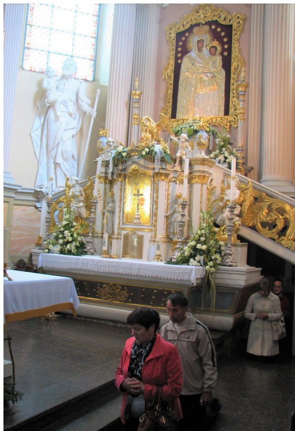
1 pav. Ėjimas keliais aplink Šiluvos Švč. Mergelės Marijos stebuklingą paveikslą.

tikrovę žmonija sukūrė panaudodama įvairias veiklas ir objektus 32 . Visuomenė yra objektyvi realybė, jai turi įtakos ir pačių žmonių sukurtas socialinis pasaulis, ir jo objektai. Kiekvienas žmonijos objektas turi savo vertybes, pasaulis tampa vertybių cirkuliacijos vieta. Taigi, kai žmonija sukuria kažkokį objektą, pavyzdžiui, meno kūrinį, jis tampa nepriklausomas nuo savo kūrėjų, o galiausiai žmonės pajunta jo įtaką.