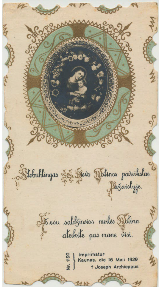
4 pav. Fotografinis Pažaislio Dievo Motinos atvaizdas, 1929 m.

Apskritai tikintieji maldose ir vizijose yra linkę suabstraktinti atvaizdą, iš materialaus jis tampa atvaizdu mintyse. Kita vertus, vizijų atvaizdas yra tapatus atvaizdui bažnyčioje 71 . Taigi Švč. Mergelės Marijos atvaizdo dvasinė esmė išlieka nepakitusi, jos šventumas