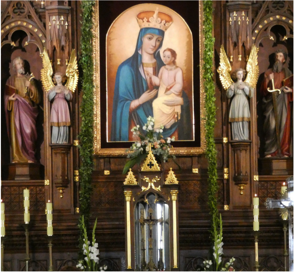
2 pav. Krekenavos Dievo Motinos paveikslas, papuoštas Žolinės šventei.